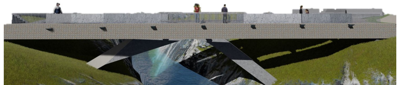
PUENTE PEATONAL - QUEBRADA "CHAQUIHUAYCCO"